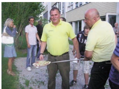
Das Abschlussfest (Schlagbauer, Agath)

Einzigartige Abende, die lange in Erinnerung bleiben werden, wie Geburtstagsfeiern, Staatsmeister im Filmklub, usw. wurden von Andreas Pesendorfer als Video-Beitrag ins „echtzeit-tv“ und „MEMA-TV“ auf Sendung gestellt. Beim gelungenen Kapfenberger Stadtfest „An(h)erzen“ am 2. Juni haben wir trotz schönstem Wetters und etwas abgelenktem „Polsterkino“ (in der Bürgermeistergarage“) von 11 Uhr bis 18 Uhr ein breites Filmprogramm vorstellen können.