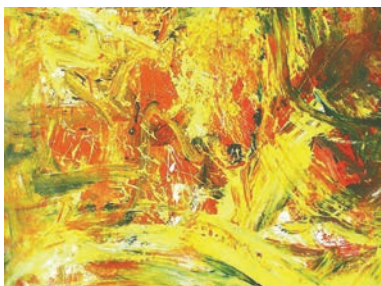
„Beziehung“-Zwei die sich finden und gemeinsam sein wollen

geboren in Bruck/Mur, wohnhaft in St. Lorenzen, seit 1999 Mitglied des Brucker Künstlerbundes; ständige Fort- und Weiterbildung im Bereich des Kunstgeschehens, Sommer- und Winterakademie in Salzburg (Galerie Weihergut), zahlreiche Ausstellungen im In- und Ausland.