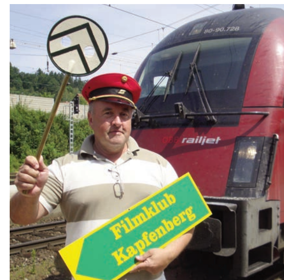
Der neue „Railjet“ der ÖBB hält extra in Kapfenberg an.